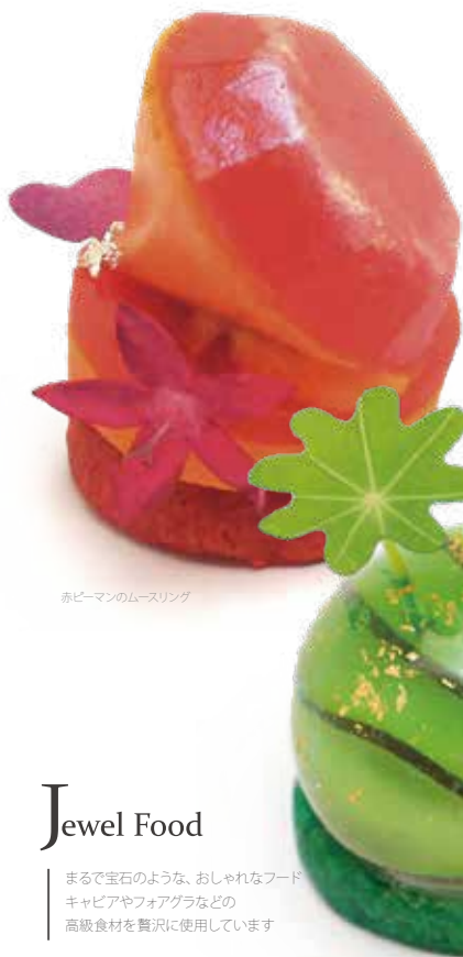
赤ピーマンのムースリング