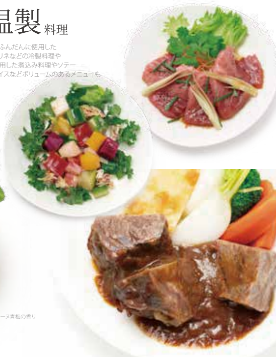
フォグラのテリーヌ青梅の香り

旬の素材をふんだんに使用した サラダやマリネなどの冷製料理や 肉や魚を使用した煮込み料理やソテー ペンネやライスなどボリュームのあるメニューも