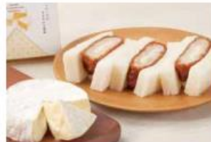
チーズメンチかつサンド

3切れ ..... 420円 (10%税込 462円) 6切れ ..... 825円 (10%税込 908円) 9切れ ..... 1,210円 (10%税込 1,331円) 18切れ ..... 2,400円 (10%税込 2,640円)