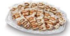
ミックスサンドオードブル

18パック ..... 3,800円 (10%税込 4,180円) 22パック ..... 4,650円 (10%税込 5,115円) 26パック ..... 5,500円 (10%税込 6,050円)