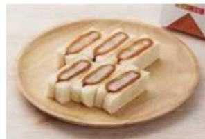
ミックスサンド(ヒレ3切れ・エビ3切れ)

3切れ ..... 450円 (10%税込 495円) 6切れ ..... 885円 (10%税込 974円)