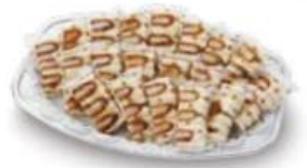
ヒレかつサンドオードブル

ミニヒレかつバーガー ..... 230円 (10%税込 253円) ミニメンチかつバーガー ..... 160円 (10%税込 176円) ミニエビかつバーガー ..... 240円 (10%税込 264円) 黒豚ミニメンチかつバーガー ..... 190円 (10%税込 209円) ミニポテココロかつバーガー ..... 170円 (10%税込 187円) ミニフィッシュかつバーガー ..... 210円 (10%税込 231円)