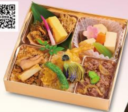
563 天・丑酉物語 1,100円 【175×175×42mm】 特定原材料