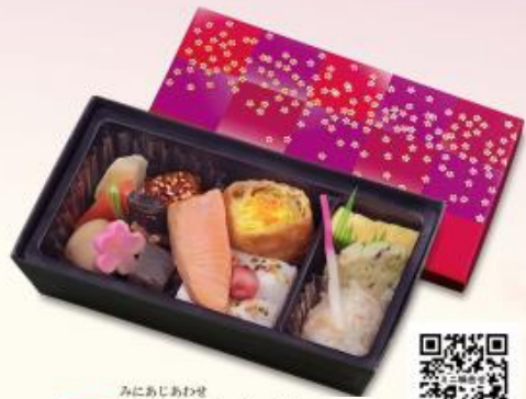
140 ミニ味合せ 880円 【190×105×40mm】 特定原材料