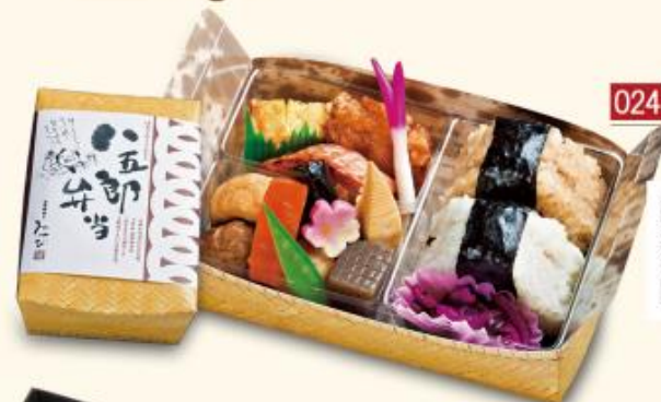
はちごろうべんとう 024 八五郎弁当 880 円 【180×110×75mm】 特定原材料