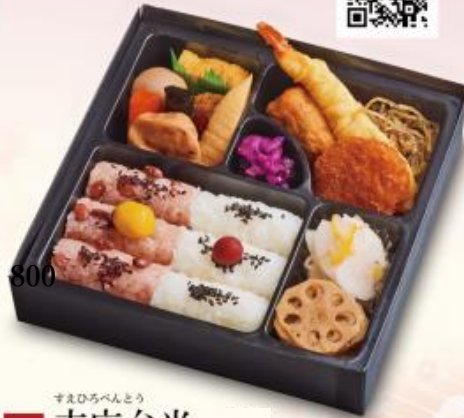
009 末広弁当 880円 【195×195×45mm】 特定原材料