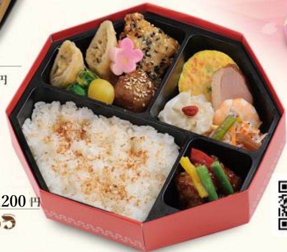
743 彩り中華弁当 1,200円 【190×190×50mm】 特定原材料