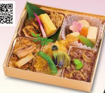
563 天・丑酉物語 1,000円 【175×175×42mm】 特定原材料