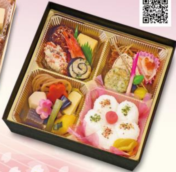
107 黒門 1,500円 (白飯・赤飯選択可能) 【205×205×48mm】 特定原材料