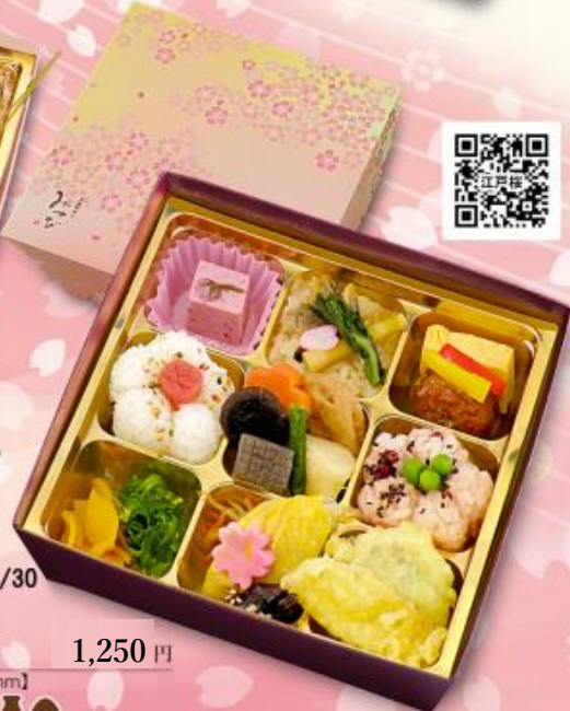
季節限定 3/1~4/30 506 江戸桜 1,250円 【198×198×50mm】 特定原材料