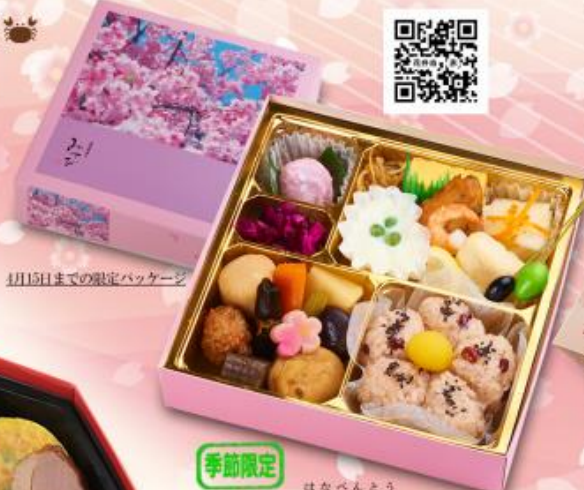
季節限定 008 花卉当 1,200円 【198×198×50mm】(白飯・赤飯選択可能) 特定原材料