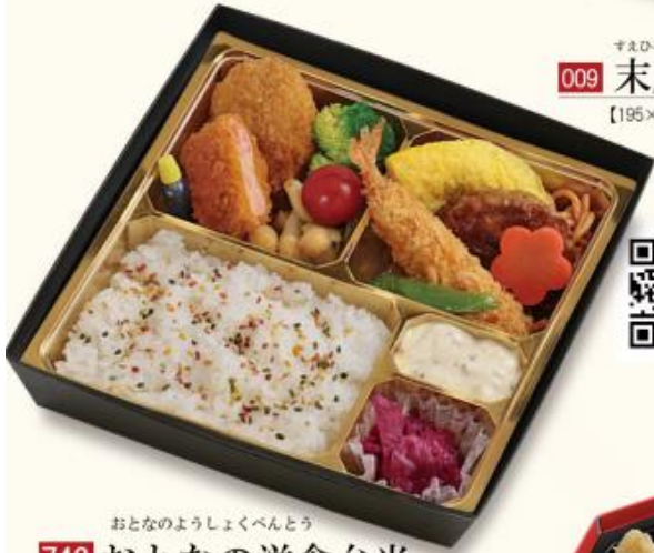
742 おとなの洋食弁当 1,100円 【198×198×50mm】 特定原材料